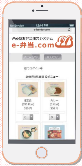
説明用の画面です

e-弁当.com (お弁当Web予約システム) は、スマホやパソコン・タブレットから、 インターネット経由で、お弁当の受注・発注 ができるシステムです。